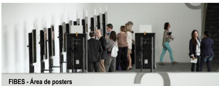
FIBES - Área de posters