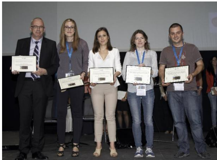
Los galardonados con las cinco Becas de Investigación SEHH 2013.

"Valoración de la alorreactividad kir en el trasplante habloidentico: valoración integral para la elección del mejor donante resumen del proyecto". Hospital Gregorio Marañón.