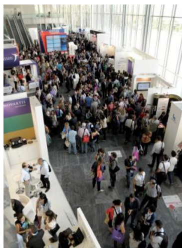
FIBES – Área de stand

Las lecciones conmemorativas Antonio Raichs y Ricardo Castillo, de gran relevancia dentro de la SEHH, por lo que suponen de reconocimiento a la trayectoria científica y profesional de sus ponentes trataron temas de vanguardia: el