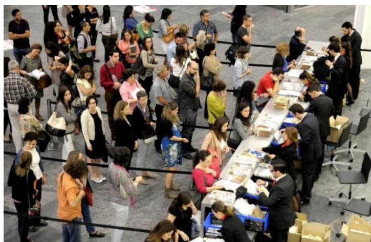
Mostrador de inscripciones en el LV Congreso Nacional de la SEHH.

El programa científico ha recogido los avances más espectaculares en la especialidad y otros temas de medicina general como las nuevas estrategias en