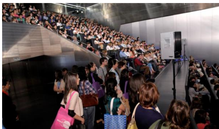
La asistencia a los simposios de este congreso ha sido masiva.

A esta jornada se inscribieron un total de 250 personas aunque los asistentes finales ascendieron a 400. En ella se presentaron datos alentadores que avalan una mejora de la supervivencia en los pacientes sometidos a trasplante en ensayos clínicos o protocolos desarrollados a nivel del Grupo Español de